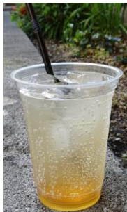
レモンジンジャー

今年は人気ドリンクメニューのイタリアンソーダとスムージーに新味を2種類ずつ加えたこともあり、例年よりも更にごたくさんのお客様に楽しんでいただけたと思っております。